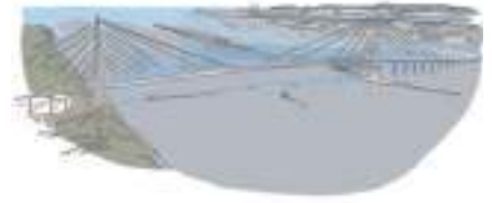
Les unités paysagères de la Communauté urbaine Le Havre Seine Métropole

Une unité paysagère est un ensemble défini spatialement à partir de caractéristiques physiques, géologiques et culturelles homogènes. Au total, 6 unités paysagères sont identifiées sur le territoire de la Communauté urbaine dans l'atlas des paysages réalisé par la DREAL Normandie en 2011.